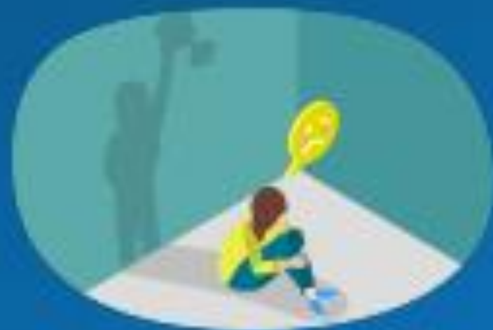
Olumlu Benlik Algısı